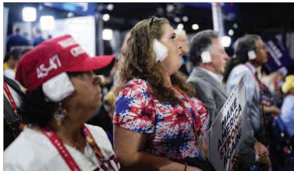
США: новый старый тренд?

Что особенно беспокоит политический класс США, так это наметившееся все более очевидное лидерство Китая в совершенство-