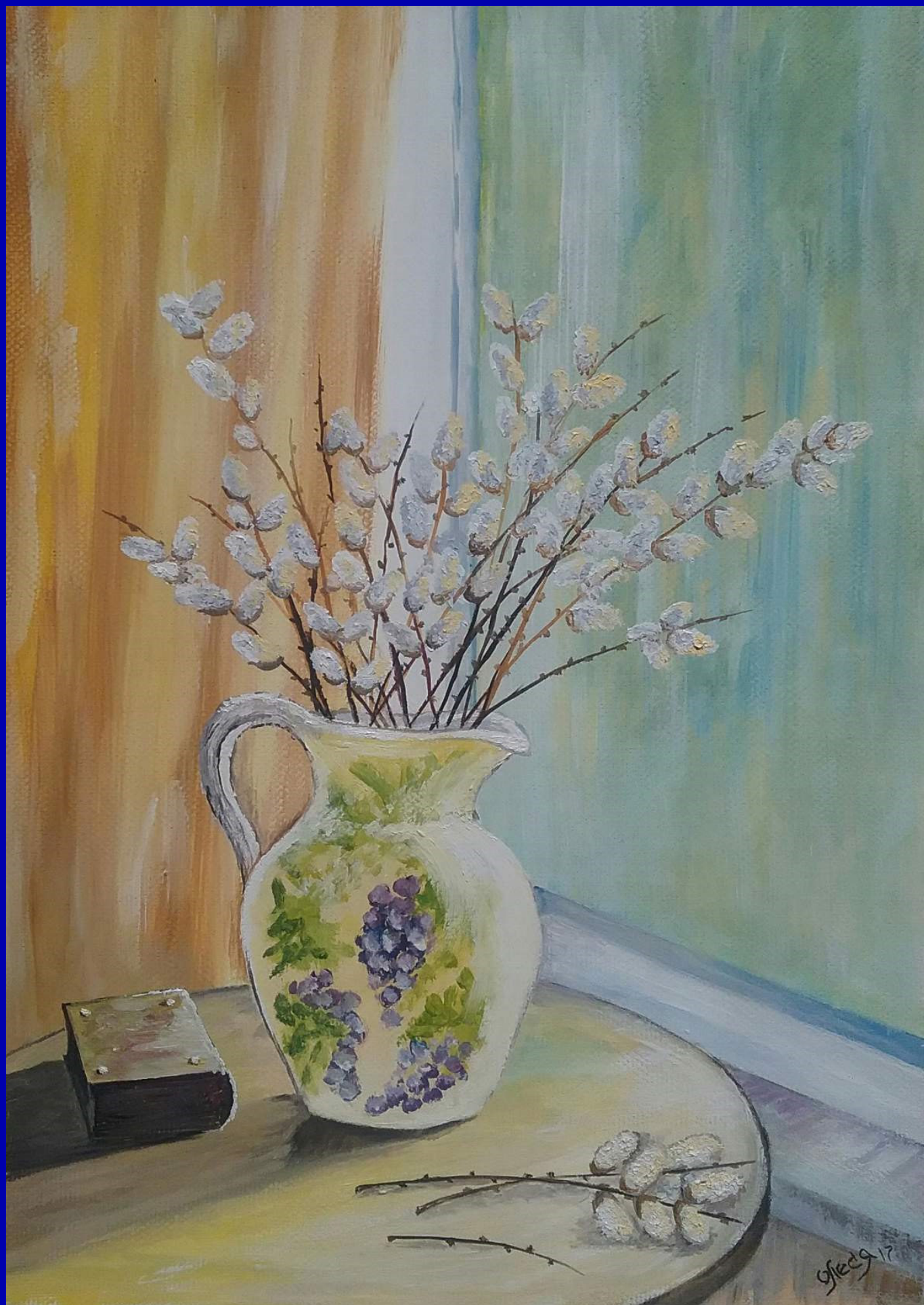
С вербным воскресеньем. Худ. Олеся Кищенко